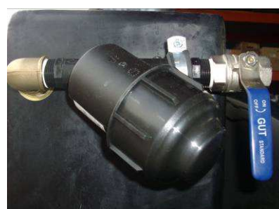
ENTRADA DE AGUA 1”